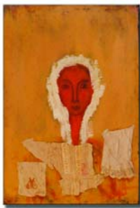
"M", stoffa e tempera su tela; cm. 47x66

"Congiungendo le une alle altre vette dei discorsi, non percorrere un solo sentiero" Empedocle di Agrigento, B.24