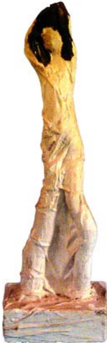
Senza titolo; alera, gesso, calza di nylon, vernice; h. 48 cm.