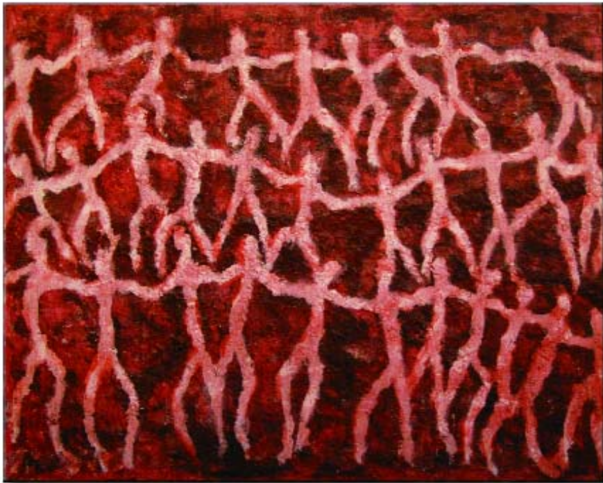
Senza titolo; carta da macero e pigmenti su poliestere da imballo; cm. 130x118; collezione privata