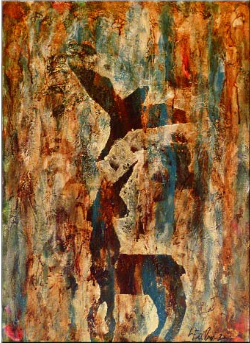
Senza titolo; pigmenti su cartone; cm. 50x70