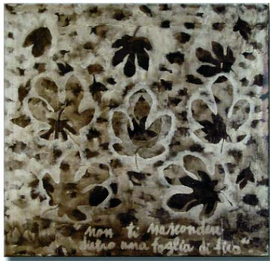
"Non ti nascondere dietro una foglia di fico"; vernici su lino; cm. 118x113