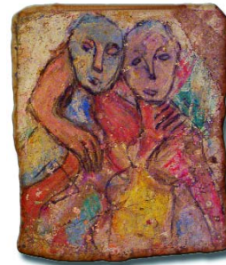
"Nudo istantaneo" tecnica mista su tela; cm. 80x60

L'espletamento del lavoro solitario si struttura negli anni, laconico e spontaneo: essendo dettato dalle influenze della cultura della sua terra e dagli attimi di una vita essenziale e defilata, l'amore per i gesti semplici e ossessivi fa affiorare sulle tele l'anelito di cose guardate con stupore e afflizione. La bellezza di movenze leggere di anime danzanti e di animali sacri che popolano una natura arcaica e selvaggia, da controllare e soffocare con impasti a bassorilievo, struttura un'architettura del colore e del movimento della luce che filtra tra le trame delle stratificazioni materiche. L'artista necessita di tornare più volte sullo stesso tema per esaurirlo