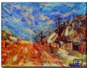
Riproduzione; olio su tela; cm. 40x28

fino alla sua scarnificazione formale e vagamente ossessiva. Il valore psicologico di questi simboli, dedotti dal mondo etrusco, è rappresentato dal meccanismo indiretto della raffigurazione che viene lasciata aperta all'occasionalità delle associazioni individuali e al rimaneggiamento cosciente dell'esperienza immediata. L'artista è mosso dal desiderio impossibile di riconciliazione con la natura e da interessi primitivi, da mettere a disposizione di nuovi contesti psichici e culturali molto più ampi, compresi fra l'espressionismo tedesco e i selvaggi francesi del primo novecento. La carica emotiva del simbolo scaturisce dalla somma delle stratificazioni affettive alle quali la forma si riferisce; in questo contesto il simbolo rive-