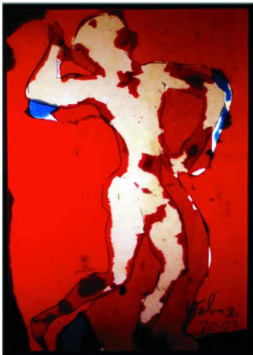
Opera retroilluminata - Light-box; carta sagomata, vetro, luce artificiale; cm. 100x80.