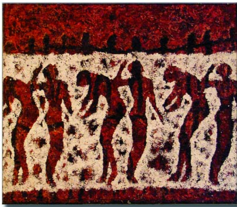
Senza titolo; tecnica mista su tela; cm. 125x109

la il suo referente che l'artista sublima attraverso visioni illuminanti sotto cui sembra soccombere e abbandonarsi. Gli strappi fatti all'immobilità del colore sembrano la guarigione di una ferita lasciata da una cicatrice sulla superficie del quadro.