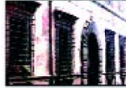
Palazzo Ascanio Celsi - particolare